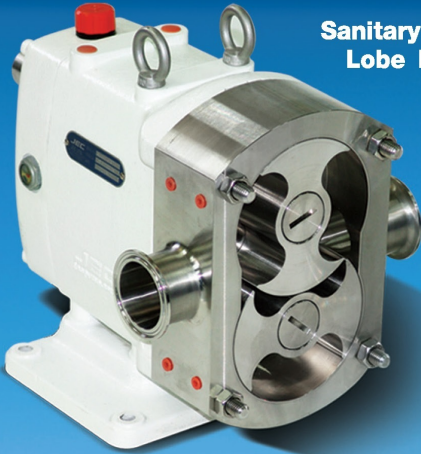
Sanitary Rotary Lobe Pump