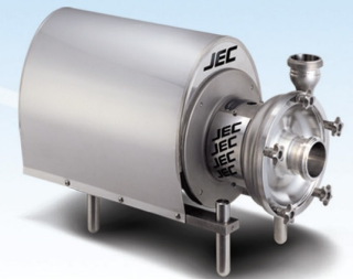
Sanitary Centrifugal Pump

เครื่องทำละลาย ส่วนผสมเพื่อการ ผลิตซอส, ซีอิ้ว, น้ำปลา, น้ำปรุงรส ต่างๆ รวมถึงละลาย น้ำตาล พงปรุงรส และส่วนผสมอื่นๆ