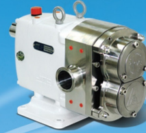
High Pressure 30 BAR