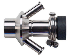
Sampling Valve for Cosmetic

บริษัท จีโเทค อินเตอร์เทรด จำกัด GEOTECH INTERTRADE CO.,LTD.