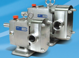
Stainless Steel Gear Box

ได้รับการรับรองจาก European Hygienic Engineering Design Group (EHEDG) โดยมีเอกสารรับรองแนบมาทั้งฉบับ